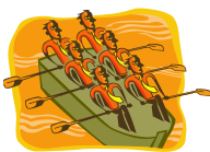
Horaires aménagés pour sportifs